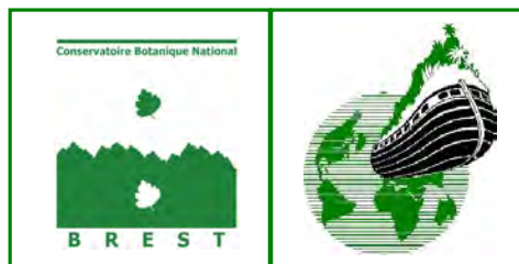
Conservatoire botanique national de Brest