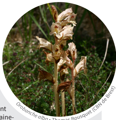
Orobanche alba