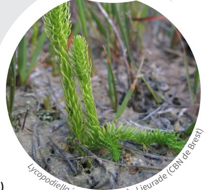
Lycopodiella inundata • Agnès Lieurade (CBN de Brest)