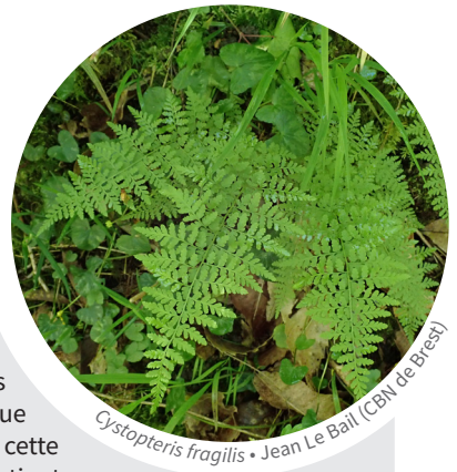
Cystopteris fragilis • Jean Le Bail (CBN de Brest)

Une seule touffe dans un chemin creux à flanc de coteau observées au lieu-dit « les Rottes » à Dissay-sous-Courcillon par Jean Le Bail en mai 2019. Cette jolie et délicate fougère est au bord de l'extinction dans la région. Dans cette dernière station spontanée, il y avait encore 38 pieds en 2013 (J. Vallet). Historiquement, la plante était connue dans 12 communes de la Sarthe. L'identité précise de cette population est à confirmer car le groupe de C. fragilis contient notamment une espèce très proche, différenciée uniquement par ses spores échinulées, C. dickiana qui a déjà été observée en Loire-Atlantique (cf. E.R.I.C.A. n°21, article de D. Chagneau). Ceci sera précisé en 2020. Trois autres taxons recherchés en Sarthe cette année, faisant partie des priorités régionales de suivi, n'ont pas été retrouvés ( Orobancha teucrii , Gentianella amarella , Asplenium septentrionale ). Tout cela n'est pas très rassurant, mais gardons espoir car il serait possible de revoir certaines de ces populations par des recherches pour poussées ou à la faveur d'années favorables.