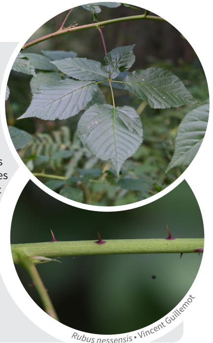
Rubus nessensis • Vincent Guillemot

Confirmation de l'identification par David Mercier.