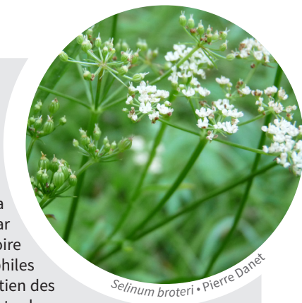
Selinum broteri • Pierre Danet

N.B. : la maille UTM (10km x 10km) n'est précisée que lorsque le taxon y est nouveau ou actualisé.