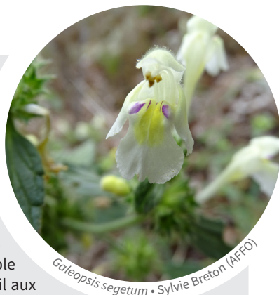
Galeopsis segetum • Sylvie Breton (AFFO)