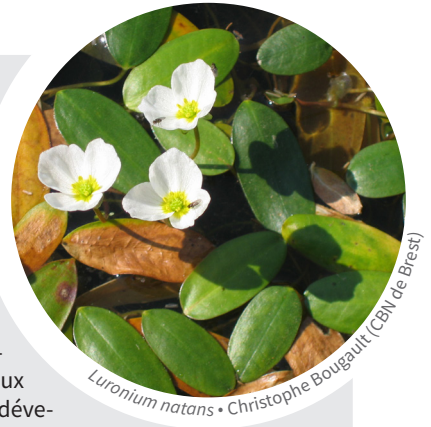
Luronium natans • Christophe Bougault (CBN de Brest)