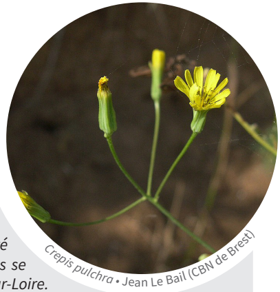
Crepis pulchra • Jean Le Bail (CBN de Brest)

Jusqu'ici, cette grande Asteraceae annuelle n'avait pas été signalée en Loire-Atlantique. Ses stations les plus proches se situent dans le Maine-et-Loire, en particulier à Montjean-sur-Loire.