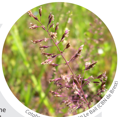
Catabrosa aquatica • Jean Le Bail (CBN de Brest)

Cette belle poacée est vivace possède des rhizomes longuement rampants et stolonifères. Le chaume est couché et radicalement à la base puis redressé. Les nœuds sont bruns noirâtres. Les feuilles sont courtes, larges de 4 à 8mm, glabres et lisses sur les 2 faces, très obtuses ou brusquement contractées en pointe au sommet. La gaine est carénée, la ligule obtuse à plus ou moins aigüe et mesure 2 à 4 mm. La panicule longtemps incluse dans la gaine supérieure, devient saillante et atteignant jusqu'à 25 cm de long. Les épillets sont bleutés violacés. Indiquée comme héliophyte ou hydrophyte des eaux eutrophes (Provost, 1998) ou oligotrophes (JM Tison, 2017), ici le milieu semble plutôt oligotrophe, compte tenu de l'absence d'amendements depuis 3 décennies (Com. orale F Dupré). Elle a été trouvée dans 3 placettes dont une avec de très nombreux individus. C'est une redécouverte majeure pour cette espèce ayant subi une régression de plus de 90% dans le département, l'autre station contemporaine de Saint-Ouen-des-Toits ayant été contrôlée mais non retrouvée.