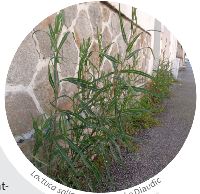
Lactuca saligna • Anthony Le Diaudic

10 pieds dans une placette décapée dans les landes de Kermadou en Langonnet (JD & AS, 09/2019). La seule autre localité morbihannaise, celle de Plaudren (GS, 2003) n'a pas été revue récemment.