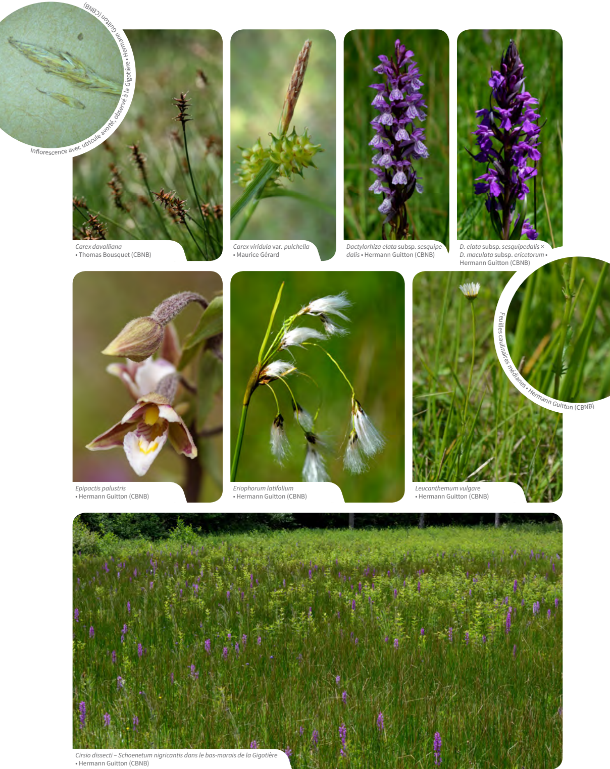
Figure 1. Planche de photographies illustrant des taxons et un syntaxon de bas-marais alcalins observés le jour de la sortie