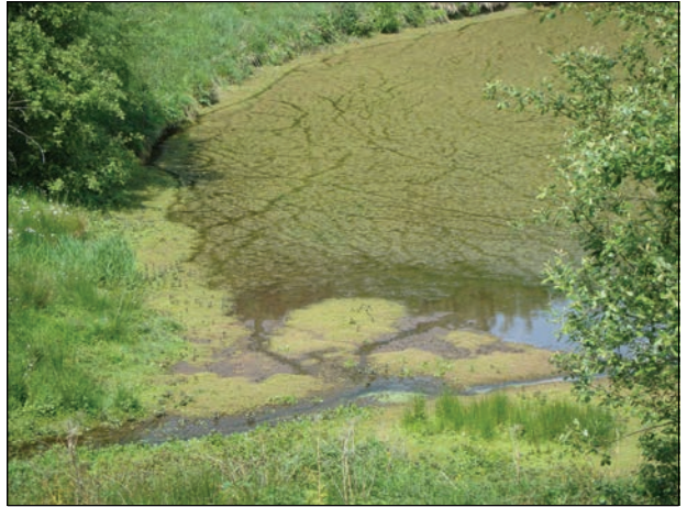
Photo 2 : Crassula helmsii au château de Chaulieu. Photo : T. Hébert, mai 2011.