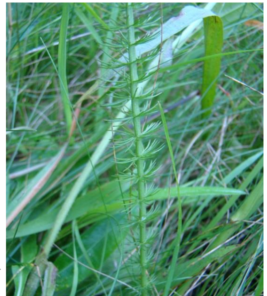
Feuilles de Thyselinum lancifolium