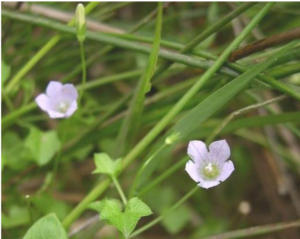
Feuilles de Wahlenbergia hederacea