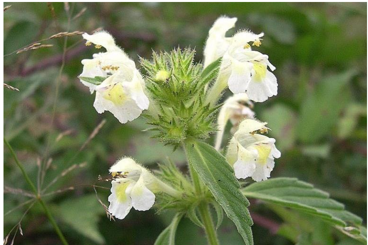
Galeopsis des moissons • photos Thomas Bousquet (gauche), Jean Le Bail (droite) (CBN de Brest)