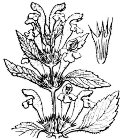
Galéopsis des moissons • Illustration extraite de la flore de Coste

Fleur d'un blanc-jaunâtre à jaune pâle , parfois rosées panachées de jaune, de 2 à 3 cm, 3-4 fois plus longue que le calice, à tube très saillant, en verticilles souvent pauciflores. Calice pubescent-soyeux, à dents presque égales, épineuses.