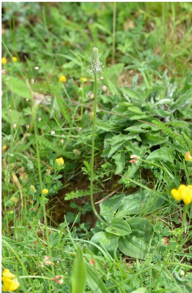
Photo : Plantago media L.