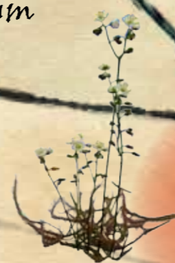
E- Drosera binata