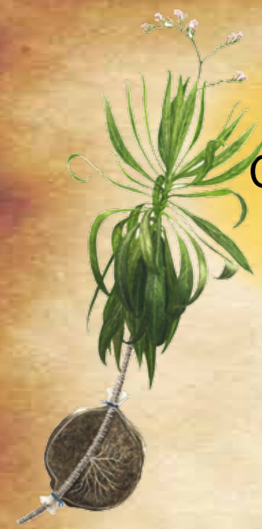
CH- Limonium dendroides