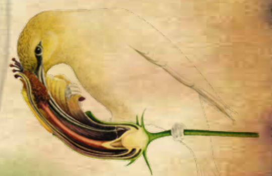
A- Hibiscadelphus giffardianus