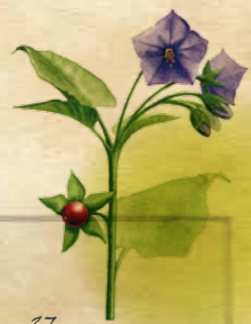
B- Normania triphylla