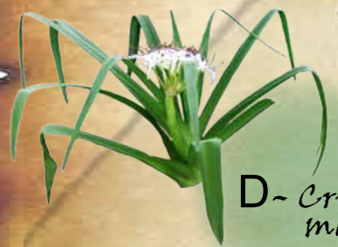
D- Crinum mauritianum