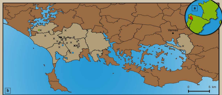
Figure 1. Cartes de répartition d' Eryngium viviparum a. Répartition mondiale b. Répartition actuelle et historique dans le Morbihan : ■ occupation actuelle ✕ occupation passée ■ sites expérimentaux de réintroduction

La population de Belz se maintient aujourd'hui grâce au statut de réserve associative attribué au site en 1987 et à la mise en oeuvre d'une gestion conservatoire, par l'association Bretagne Vivante, depuis 1991. Cependant dans sa situation d'isolement, cette ultime population, de petite taille, est vulnérable. Elle est exposée à une perte de viabilité et à une diminution de l'adaptation locale des individus, qui augmenteraient les risques d'extinction face aux aléas environnementaux.