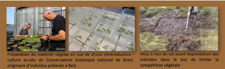
Figure 2. a. Préparation du matériel végétal en vue de réintroduction - culture ex-situ du Conservatoire botanique national de Brest, originaire d'individus prélevés à Belz. b. Mise à nue du sol avant implantation des individus dans le but de limiter la compétition végétale.